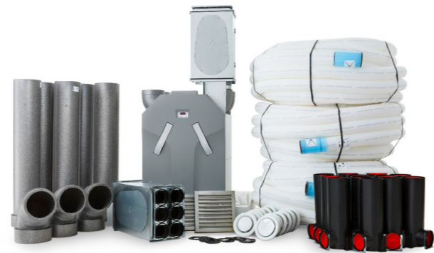
Roostevaba välisrest õhuvõtt/ heitõhk