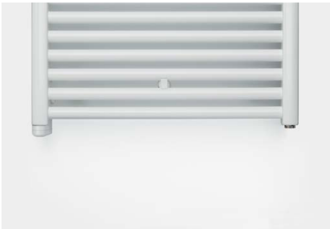
Ausführung Elektrobetrieb mit eingebautem Heizstab

V20210612, RAD_DAS, DE_de, Änderungen vorbehalten